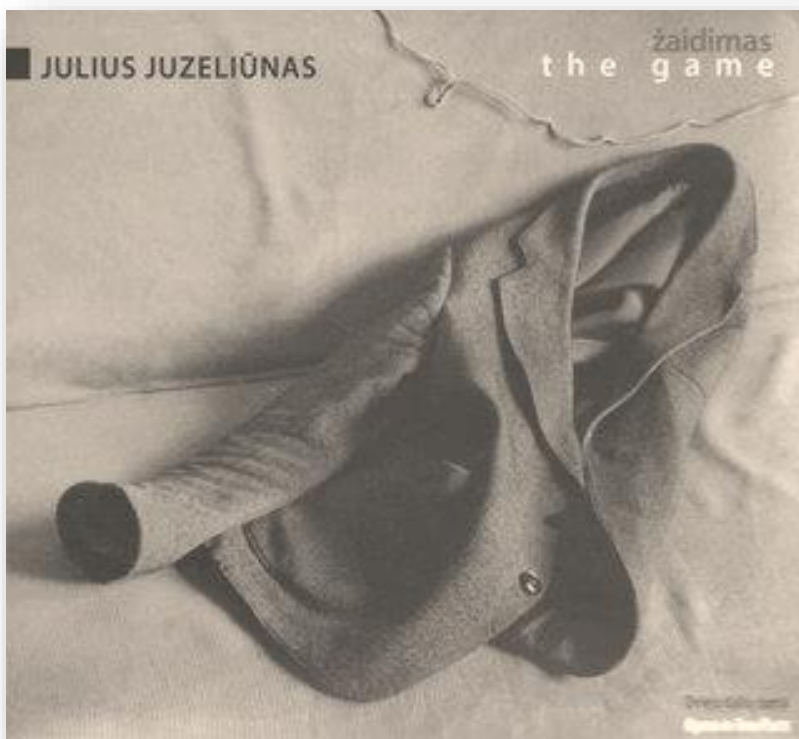
Operos "Žaidimas" kompaktinės plokštelės viršelis

Vienas svarbesnių projektų bus operos „Žaidimas“ pastatymas.