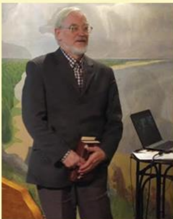
Renginio svečias muzikologas, humanitarinių mokslų daktaras Rimantas Astrauskas